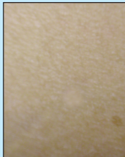
MACCHIE SENILI DECOLTÈ